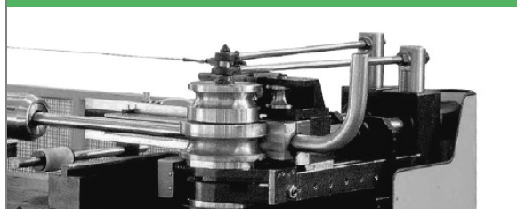
PROVAR 5 U-D